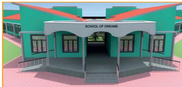
Maquette de présentation de la future école

En 2022-2023, la DIY a pu former une équipe de 12 membres pour supporter sur place le projet « School of Dreams » porté par l'organisme Perspective Development Skills (PDS). Ainsi, grâce au financement du Crédit Agricole, à des ventes sur le campus de l'université et à des dons, 8 000 euros ont pu être envoyés à PDS. L'objectif était donc de commencer la construction de deux salles de classes et de bureaux. En effet, « School of Dreams » est une initiative sur le long terme visant à proposer aux enfants du village de Jendele à Zanzibar (ainsi qu'aux alentours), une éducation qualitative avec des salles de classe en bon état et des espaces sportifs.